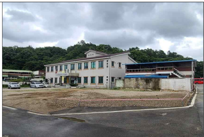
추가 매입 부지 철거